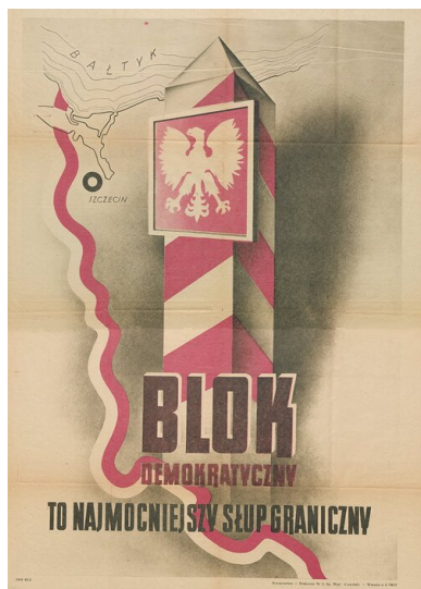
Plakat wyborczy tzw. Bloku Demokratycznego

Komuniści i związani z nimi figuranci rozpoczęli grę przedwyborczą w końcu 1945 r. Pierwszym pomysłem, mającym uniemożliwić realną ocenę posiadanych przez poszczególne partie wpływów w społeczeństwie, stała się koncepcja bloku wyborczego, obejmującego wszystkie działające na scenie politycznej legalne ugrupowania. Istotę propozycji określał proponowany podział mandatów. Dla PSL, partii najsilniejszej, przewidywano zaledwie 20% mandatów. Kontrpropozycja kierownictwa PSL, by dla „reprezentacji wsi” przeznaczyć 75% mandatów, została z kolei odrzucona przez wspólną reprezentację PPR i PPS, więc od marca 1946 r. stało się jasne, że podczas wyborów przeciwko komunistom i ich sojusznikom stanie tak PSL, jak i rosnące w siłę, a odrzucające umizgi ze strony komunistów (Popielowi w zamian za przystąpienie do Bloku Stronnictw Demokratycznych proponowano objęcie stanowiska ministra Ziem Odzyskanych) Stronnictwo Pracy.