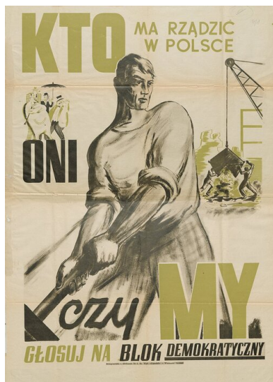
Plakat wyborczy tzw. Bloku Demokratycznego

środowisk opozycyjnych. W odniesieniu do Kościoła i środowisk z nim związanych rolę dywersyjną – a wręcz agenturalną – pełnił, mający swą trybunę w uruchomionym w końcu listopada piśmie „Dziś i Jutro”, Bolesław Piasecki.