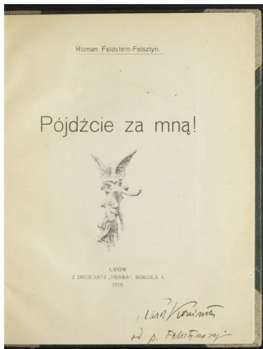
Strona tytułowa ze zbioru poezji Romana Feldsteina-Felstyna Pójdźcie za mną! , wydane go po jego śmierci, staraniem matki, we Lwowie w 1919 r. Ze zbiorów BN - polona.pl