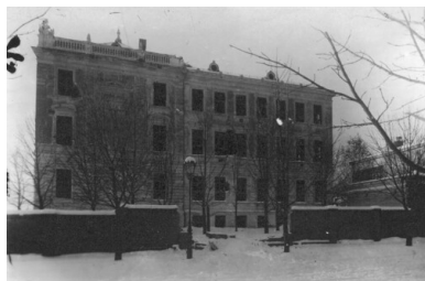
Budynek szkoły im. Sienkiewicza we Lwowie, 1918.