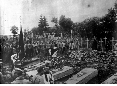
Pogrzeb polskich obrońców Lwowa poległych w obronie tego miasta przed Ukraińcami, listopad 1918 r.