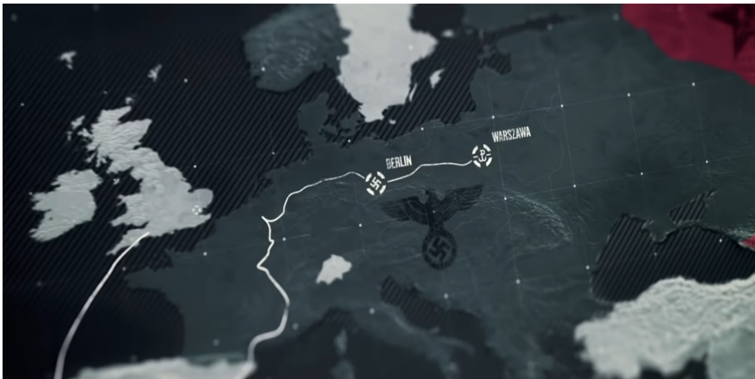
Kadr z filmu IPN "Niezwycięzeni"

https://przystanekhistoria.pl/pa2/teksty/88384,Niemcy-Watykan-i-Europa-w-czasach-Edyty-Stein.html