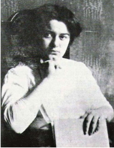
Edyta Stein na fotografii z około 1913 r.