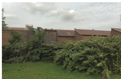
Zabudowania dawnej Huty „Baildon”, 2021 r.

dlatego huta ma się stać siedzibą jednej z grup regionalnego kierownictwa Związku.