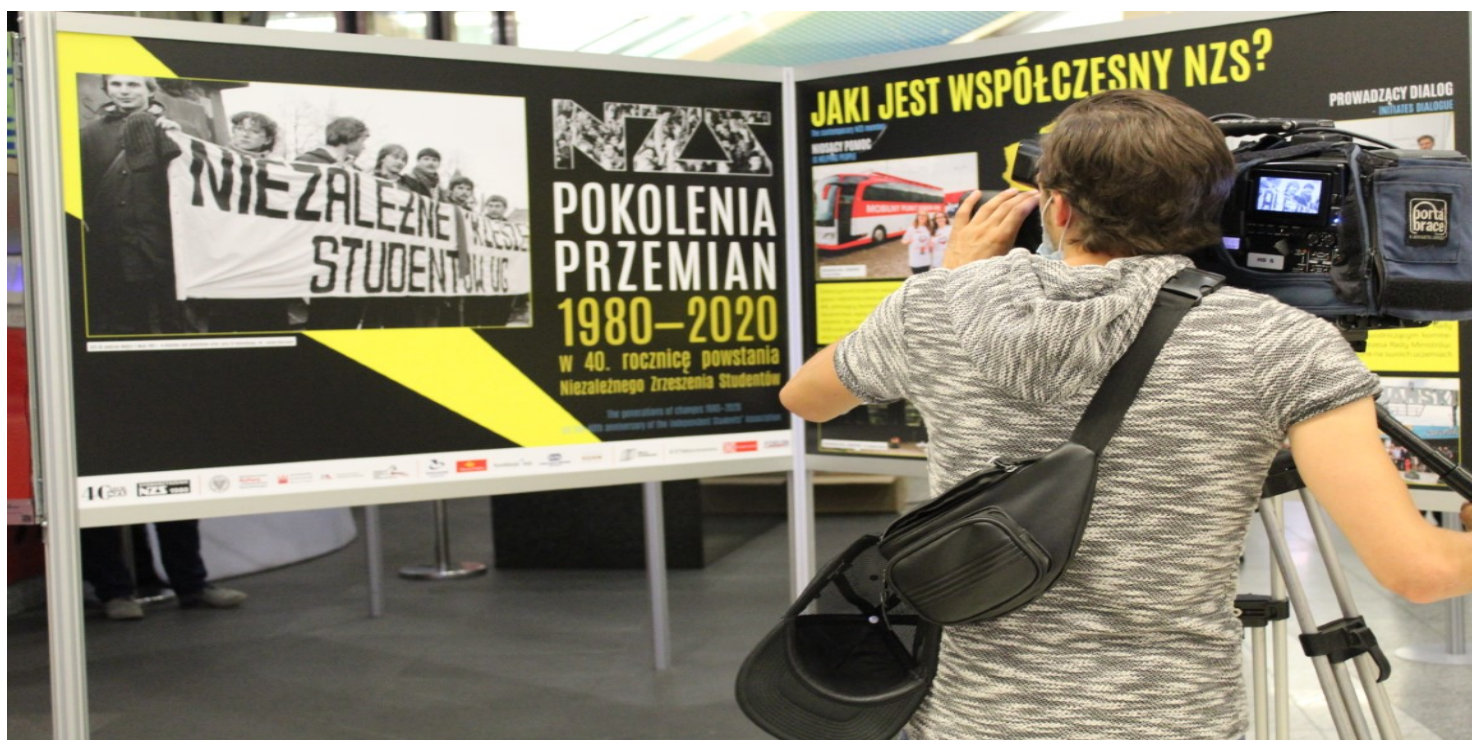
Odsłonięcie wystawy „NZS - pokolenia przemian 1980-2020” na Dworcu Głównym w Krakowie.

https://przystanekhistoria.pl/pa2/teksty/87964,Bialostockie-Niezalezne-Zrzeszenie-Studentow-w-latach-1982-1983.html