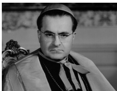
Kardynał Julius Döpfner

List podpisało 41 hierarchów z Niemiec Zachodnich i Wschodnich. Przed wysłaniem odpowiedzi treść prawdopodobnie była konsultowana z zachodnioniemieckim historykiem Kościoła Hubertem Jedinem, który zalecał niepodejmowanie tematów kontrowersyjnych i skoncentrowanie się na ogólnikach i aspektach historycznych.