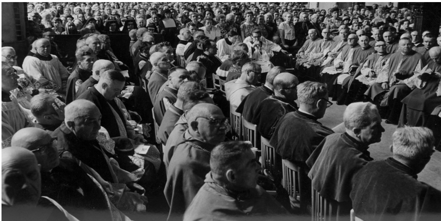
Biskupi zgromadzeni w warszawskiej katedrze na sesji naukowej w ramach obchodów Tysiąclecia Chrztu Polski, 24 czerwca 1966 r.

https://przystanekhistoria.pl/pa2/teksty/87541,Oredzie-wybaczenia-i-pojednania.html