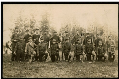
Polska, popisy harcerskie w Sejnach, 1923.