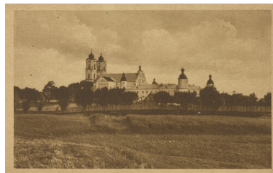
Polska, Wyższe Klasyczne Gimnazjum Biskupie im. św. Kazimierza w Sejnach (widok ogólny kolegiaty i Gimnazjum), okres Drugiej Rzeczypospolitej. Pocztówka