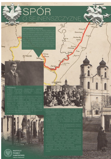
„Spór o Sejneńszczyznę”...

Powstanie sejneńskie wymyka się jednoznacznej ocenie. Polskie zwycięstwo zostało okupione życiem poległych w walce 9 Litwinów oraz 37 Polaków. Wywołało po polskiej stronie euforię, po litewskiej – oburzenie i wolę kontynuowania walki. Z jednej strony powiększyło terytorium Polski i spełniło oczekiwania polskich mieszkańców, z drugiej przyczyniło się do pogrzebania szans organizowanego w tym czasie przez władze w Warszawie zamachu stanu na Litwie, który miał doprowadzić do zmiany rządu w Kownie na bardziej przyjazny Polsce. Było jednym z nielicznych udanych polskich powstań narodowych, ale jednocześnie wymierzone było przeciwko dawnym przyjaciom, z którymi wspólnie przez wieki tworzyliśmy Rzeczpospolitą.