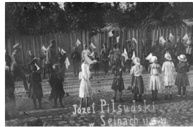
Sejneńskie dzieci witają Naczelnika Państwa Józefa Piłsudskiego, 14 września 1919 r.