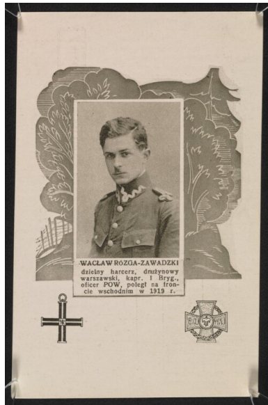
Wacław Różga-Zawadzki, harcerz, drużynowy warszawski, kapral I Brygady, oficer POW, stanął w obronie polskich Sejn będąc jednym z inicjatorów, a potem dowódców powstania sejneńskiego, w którym też poległ. Za wierną służbę Polsce pośmiertnie awansowany do stopnia podporucznika i