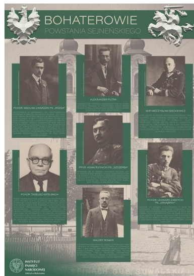
...„Bohaterowie Powstania Sejneńskiego” i...