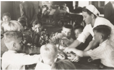
Dzieci podczas posiłku w stołówce Państwowego Urzędu Repatriacyjnego, 1945-1946 r.

Aby zmanifestować narodowość polską ludzie składali podania o wyjazd, nie mając w rzeczywistości takiego zamiaru. Mimo początkowego bagatelizowania sprawy przez władze („Polaków tu nie ma, są jedynie spolonizowani Białorusini”), szybko okazało się, że problem obecności Polaków w republice jest poważny.