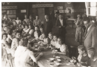
Mali ekspatrianci w stołówce Państwowego Urzędu Repatriacyjnego.

Stosowanie przymusu, represji, zastraszania i innych środków administracyjnych doprowadziło do sytuacji, która zaniepokoiła władze sowieckiej Białorusi, gdyż na przełomie wiosny i lata 1945 r. dostrzegły one, że masowe wyjazdy Polaków paraliżują życie gospodarcze i prowadzą do wyludnienia poszczególnych obszarów. Jak donosiły partyjne źródła, wiosną 1945 r. z Grodna wyjechali albo zgłosili taki zamiar prawie wszyscy nauczyciele, lekarze, aptekarze, a także wykwalifikowani robotnicy narodowości polskiej. Podobnie wyglądała sytuacja w drugim co do wielkości mieście obwodu grodzieńskiego – Lidzie, gdzie prawie połowa kwalifikowanej siły roboczej zgłosiła chęć wyjazdu. Korzystając z możliwości, do Polski usiłowali dostać się też Białorusini, a nawet Rosjanie podszywający się pod Polaków. Dla osób znajdujących się na zesłaniu czy „oddelegowanych” do przymusowych robót w głąb ZSRS przyznanie się do polskości oznaczało szansę na wydobyć się z koszmaru.