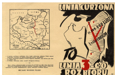
Ulotka antykomunistyczna z okresu II wojny światowej,

Władze w Mińsku uznały, że wszyscy Polacy wyjechali do Polski, pozostali zaś to „spolonizowani” Białorusini. Kwestia obywateli narodowości polskiej w BSRS po raz ostatni pojawiła się na porządku dziennym w materiałach partyjnych w rezolucji VI Plenum KC KP(b)B, które odbyło się w czerwcu 1947 r. Od tamtego czasu w oficjalnych dokumentach nie ma nawet wzmianki o pracy partyjno-politycznej wśród miejscowych Polaków.