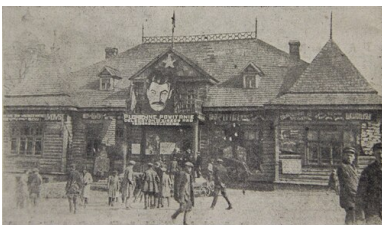
Dom Ludowy w Dzierżyńsku w 1932 r. ozdobiony portretem Feliksa Dzierżyńskiego i szyldem w języku polskim. Do 1932 r. miasto nosiło nazwę Kojdanów

W dwóch autonomiach – Polskim Rejonie Narodowym im. Juliana Marchlewskiego (Marchlewszczyźnie) powstałym w 1925 r. na sowieckiej Ukrainie oraz Polskim Rejonie Narodowym im. Feliksa Dzierżyńskiego (Dzierżyńszczyźnie) powołanym do życia w 1932 r. na terytorium Białoruskiej SRS – tworzono polskie rady wiejskie, przedszkola, szkoły, technika pedagogiczne, domy dziecka, sądy, instytucje kultury i oświaty. Na sowieckiej Białorusi język polski uzyskał – obok białoruskiego, rosyjskiego i jidysz – status języka państwowego. Bolszewicy traktowali polskie autonomie jako swego rodzaju model mający służyć do przetestowania pewnych rozwiązań przed przeniesieniem ich do podbitej w przyszłości Polski.