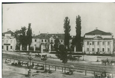
Polska, Pałac Bielskich we Lwowie z (prawdopodobnie) około 1870 roku.

Każdej jesieni kolektyw teatralny inaugurował uroczyste kolejne sezony działalności. Nie inaczej było w 1981 r. Po zakończeniu przerwy letniej, 12 października w sali Domu Nauczyciela we Lwowie (dawnym pałacu Bielskich) przy ul. Kopernika 42 wystawiono Wesele Wyspiańskiego.