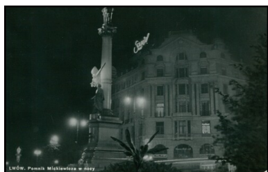
Polska, Lwów, pomnik Adama

Według późniejszych słów studentów ci ostatni zaczepili grupę, ocierając się o kilka osób, co spotykało się ze zwróceniem im uwagi w zdecydowany sposób. Fakt ten zauważyli dwaj lwowscy milicjanci. Pod zarzutem głośnego zachowania w przestrzeni publicznej po godzinie 23 odprowadzili grupę na komisariat. Po wylegitymowaniu reżyser złożył na piśmie stosowne oświadczenie. Zaznaczył w nim, że całe zdarzenie pod pomnikiem Mickiewicza trwało niecałe pięć minut i przebiegało bardzo cicho, bez wznoszenia okrzyków. Po zakończeniu czynności wszyscy zatrzymani zostali zwolnieni do domów.