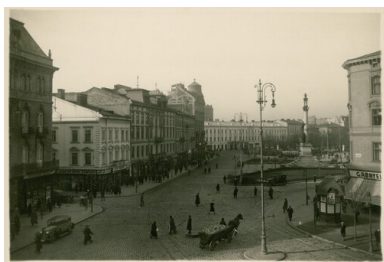
Polska, Lwów, plac Mariacki i pomnik Adama Mickiewicza, przed 1925. Ze zbiorów BN - polona.pl (autor zdjęcia: Marek Münz)

Wyjątkiem nie był w tym zakresie Lwów, w którym nadal zamieszkiwało kilkanaście tysięcy Polaków, zachowujących dawne tradycje w zaciszu prywatnych domów. Język polski rozbrzmiewał tu także w liturgii dwóch czynnych kościołów rzymskokatolickich oraz dwóch szkołach średnich z polskim językiem wykładowym.