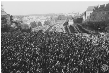
Ludzie zebrani na placu Zamkowym w Warszawie po zamachu na papieża Jana Pawła II, maj 1981. Widok w kierunku Wisły i Trasy W-Z.

Zastanawiający jest także zapis służbowych czynności Breżniewa 13 maja 1981 r. Rano spotyka się z delegacją kongijską i podpisuje dwa porozumienia z przedstawicielami tego państwa. Około 13.00 przychodzi do swego gabinetu na Kremlu i – jak zanotowano w terminarzu – samotnie pracuje nad dokumentami. Z nikim się nie spotyka, nie prowadzi w tym czasie żadnych rozmów telefonicznych. Jakby czekał na ważną informację. Po 18.00 opuszcza Kreml i udaje się do swej rezydencji pod Moskwą. Następnego dnia na Kremlu pojawił się minister spraw zagranicznych Andriej Gromyko, a dzień później Andropow.