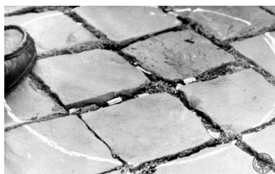
Watykan, Rzym, Plac św. Piotra - zabezpieczone po zamachu na Ojca Świętego Jana Pawła II łuski.

22 maja 1979 r. gen. mjr Anatolij Kiriejew 14 , naczelnik 12 Wydziału I Zarządu Głównego KGB ZSRS, skierował zapytanie do kierownictwa struktur KGB na Ukrainie i na Litwie – czy mogą pomóc w zdobywaniu informacji oraz prowadzeniu działań dezinformacyjnych wymierzonych przeciwko papieżowi. Na Litwie odbiorcą tego pisma był przewodniczący KGB Litwy, natomiast w przypadku Ukrainy zostało ono skierowane nie do przewodniczącego KGB Ukrainy, lecz właśnie do gen. Miakuszki 15 . Niestety, nie znamy odpowiedzi na pytanie zadane przez Moskwę. Wszystko jednak wskazuje na to, że taka operacja przez I Zarząd KGB Ukrainy została podjęta, ale jej dokumentacja znajduje się w zasobach Służby Wywiadu Zagranicznego Ukrainy i jest tajna.