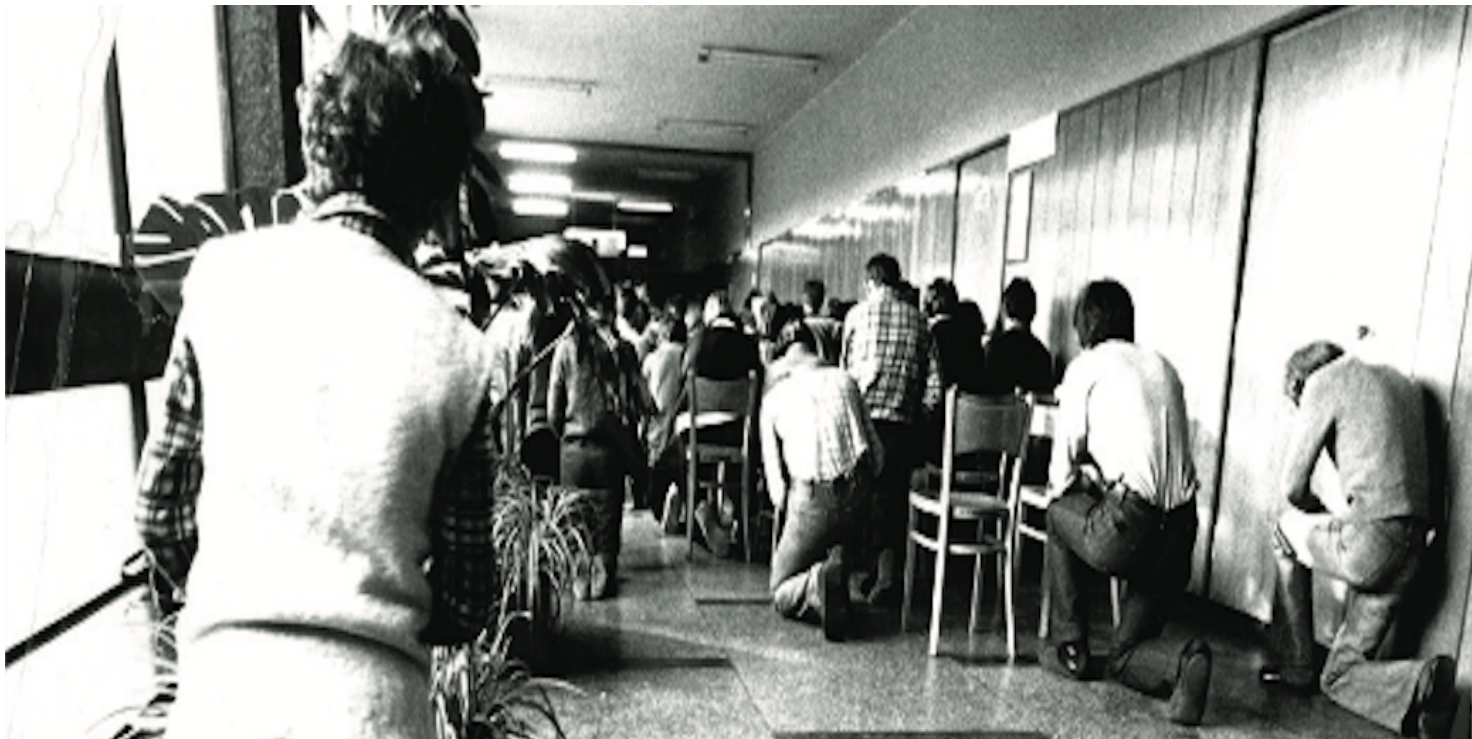
Msza św. w gmachu Wydziału Matematyczno-Fizycznego UŁ, 1981 r.

https://przystanekhistoria.pl/pa2/teksty/86767,quotJa-juz-jestem-magistrem-a-wy-jeszcze-niequot-Walka-o-Niezalezne-Zrzeszenie-S.html