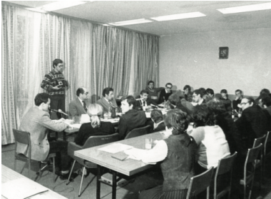
Rozmowy strajkujących studentów z przedstawicielami władz; Uniwersytet Łódzki, 1981 r.

Te słowa spotkały się z dezaprobatą strajkujących. Tak zaczęte rozmowy nie zapowiadały się na łatwe i nie wróżyły szybkiego zakończenia negocjacji.