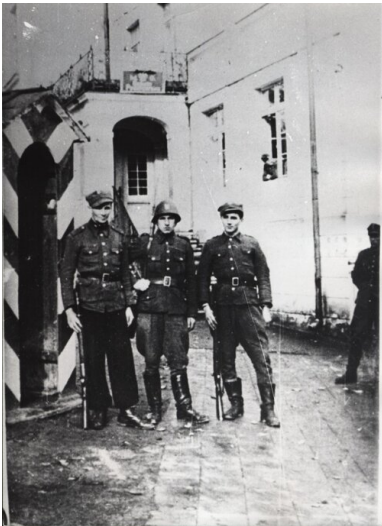
Kursanci I turnusu Szkoły Podoficerskiej KW MO Gdańsk w Sopocie, jesień 1945 r.