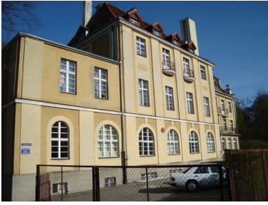
Druga siedziba Komendy Powiatowej MO w Sopocie, a później Szkoły Podoficerskiej KW MO z siedzibą w Sopocie, ul. 1 Maja 12, stan obecny