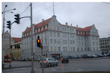
Pierwsza siedziba KW MO w Gdańsku, a potem KM MO i MUSW, ul. Nowe Ogrody 27, stan z 2014 r.