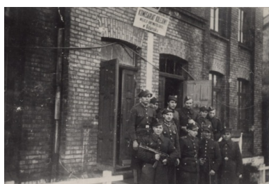
Komisariat Kolejowy MO w Gdańsku.

Przez wiele lat w Gdańsku funkcjonowała Milicyjna Izba Dziecka (ul. Wesołowskiego 10 we Wrzeszczu). Po całym mieście były rozsiane placówki ORMO, zaś w Złotej Karczmie mieściła się baza okrytego złą sławą ZOMO.