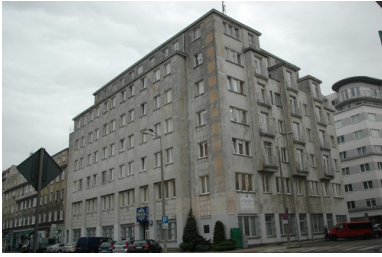
Pierwsza siedziba KM MO w Gdyni, ul. Portowa 15, stan z 2014 r.