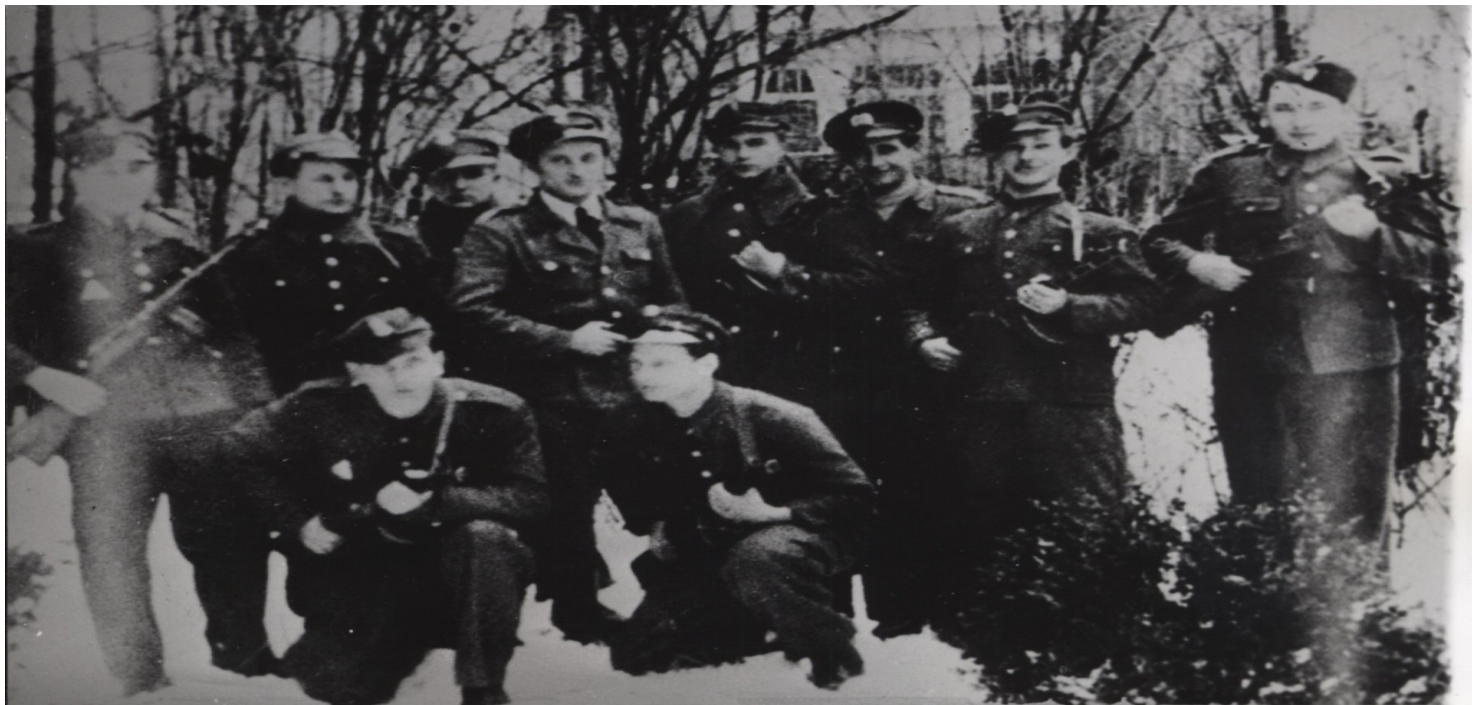
Grupa pracowników MO i SB ochraniająca obwód wyborczy w Sopocie, wybory do Sejmu Ustawodawczego z 1947 r.

https://przystanekhistoria.pl/pa2/teksty/86318,Sladami-represji-Wykaz-wazniejszych-jednostek-Milicji-Obywatelskiej-w-Trojmiesci.html