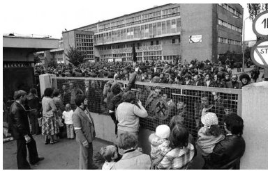
Rodziny strajkujących górników przy ogrodzeniu kopalni „Manifest Lipcowy”, Jastrzębie Zdrój, wrzesień 1980 r. Fot. Stanisław Jakubowski/PAP (za: „Biuletyn IPN”, nr 7-8/2020)

Komuniści próbowali poddać pismo rozmaitej kontroli, w tym oficjalnej cenzurze. Już w listopadzie 1980 r. analizą treści biuletynu zajął się specjalny zespół złożony z przedstawicieli Komitetu Wojewódzkiego partii, Komendy Wojewódzkiej MO, katowickiej Delegatury Głównego Urzędu Kontroli Prasy Publikacji i Widowisk oraz prokuratury. Wyniki prac zespołu zaprezentowano w grudniu 1980 r. na posiedzeniu sekretariatu KW PZPR w Katowicach. Według tych ustaleń biuletyn cechował