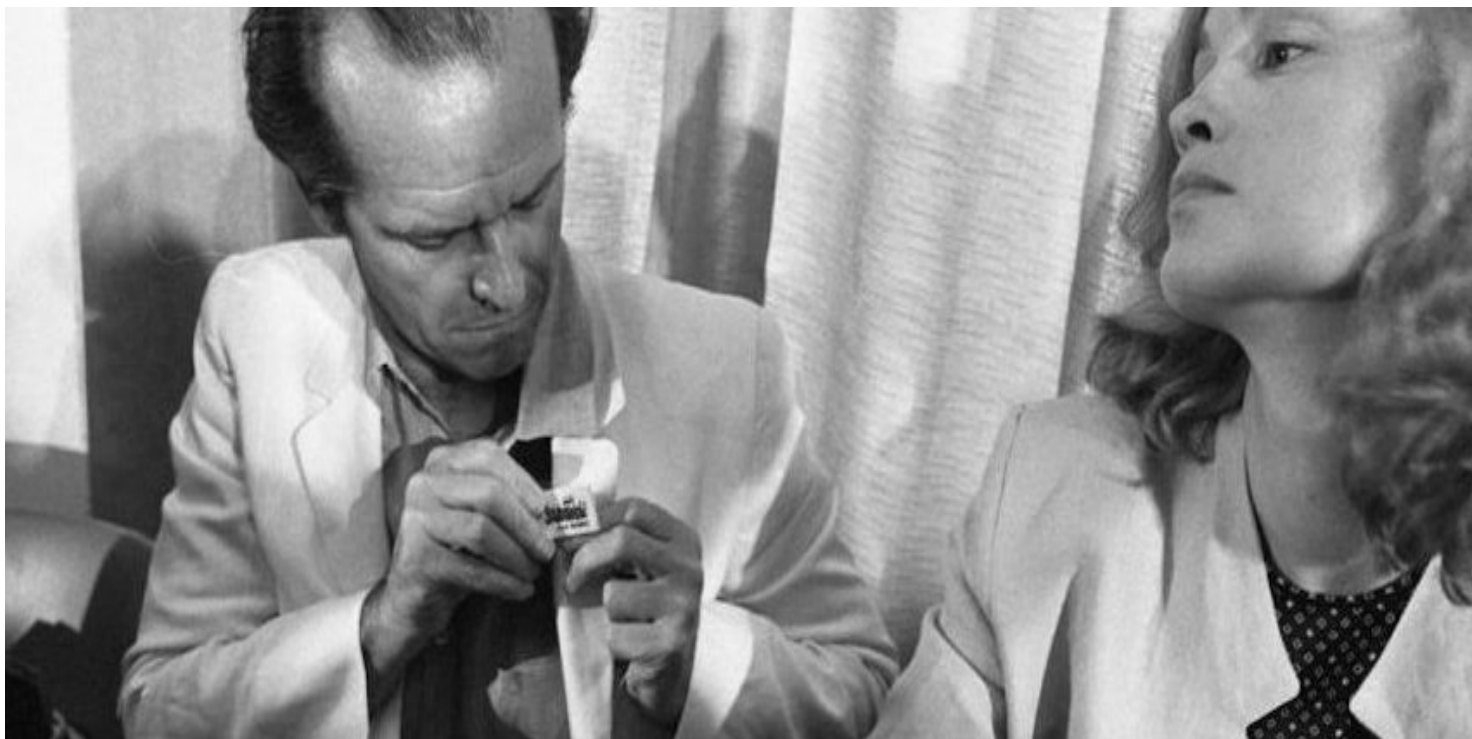
Jack Nicholson i Jessica Lange w Cannes w 1981 roku

https://przystanekhistoria.pl/pa2/teksty/85634,Solidarnosc-na-listach-przebojow.html