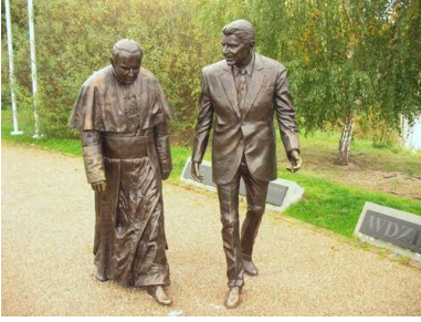
Pomnik papieża Jana Pawła II i prezydenta USA w l. 1981-1989 Ronalda Reagana w Gdańsku