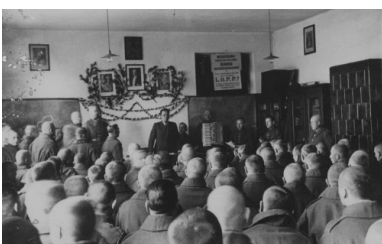
Odczyt w więzieniu Wojskowym Więzieniu Śledczym w Krakowie, zorganizowany przez Oddział Polskiego Białego Krzyża w Krakowie.

Od 1936 r. pręźnie zakładano Koła Polskiego Białego Krzyża w szkołach wszystkich typów. Miało to spopularyzować organizację wśród młodzieży szkolnej 18 . Zakładano, że w przyszłości tylko rekruci z ukończoną szkołą powszechną będą przyjmowani do wojska. W tym czasie PBK miał skoncentrować swą działalność w świetlicach żołnierskich, w których wojskowi spędzali godziny pozasłużbowe. Dążono do tego, aby każde koło wzięło pod swoją opiekę lub zorganizowało chociaż jedną świetlicę w pułku.