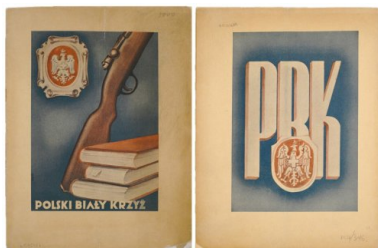
Okładka publikacji z 1939 r.

mogły powstawać w garnizonach wojskowych, a od 1936 r. także w miejscowościach, w których dany oddział wojskowy stacjonował. Od 1936 r. warunkiem istnienia koła PBK była przynależność do niego co najmniej dziesięciu osób.