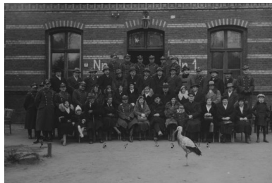
Uczestnicy uroczystości otwarcia świetlicy batalionu morskiego urządzonej przez Polski Biały Krzyż. Wśród siedzących widoczni

„Jeżeli członkowie Polskiego Czerwonego Krzyża z dumą powiadają, iż w każdej chwili służą bliźniemu zarówno w czasie wojny, jak i spokoju, to znowu członkowie Polskiego Białego Krzyża mogą z nie mniejszą dumą rzec: «Jesteśmy pomostem łączącym wojsko ze społeczeństwem; budzimy miłość do żołnierza; szerzymy oświatę i kulturę, rozwijamy duchowe i umysłowe wartości żołnierza polskiego; wpajamy w społeczeństwo wiarę i pewność, że ściska więź Narodu z Armią stwarza siłę moralną, której nic zachwiać nie zdoła »” 7 .