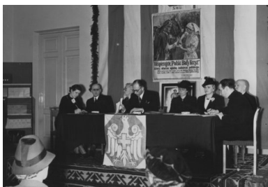
Prezydium Walnego Zjazdu Delegatów i Kół Polskiego Białego Krzyża w Kasynie Garnizonowym

W okresie międzywojennym PBK przechodził liczne zmiany statutowe, dostosowując swoją działalność do aktualnych potrzeb wojska 9 .