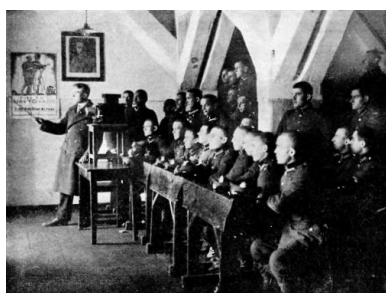
Lekcja historii Polski prowadzona przez Polski Biały Krzyż. Na scianie obok portretu Józefa Piłsudskiego plakat promujący PBK.

Paderewska wróciła do Polski w grudniu 1918 r. i została pierwszym prezesem PBK 3 .