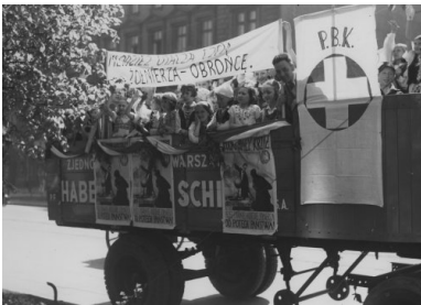
Tydzień Polskiego Białego Krzyża w Warszawie, 15 maja 1938 r.

Działalność PBK promowano podczas Tygodni Polskiego Białego Krzyża, wzorowanych na Tygodniach Czerwonego Krzyża. Organizowano je w celu popularyzacji idei i założeń PBK, a także uzyskania wsparcia finansowego. Akcję tę prowadzono w szkołach, ośrodkach powiatowych i gminnych oraz punktach oświatowych.