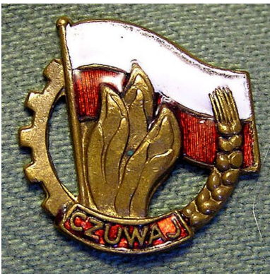
Odznaka Organizacji Harcerskiej Związku Młodzieży Polskiej (1950-1956)

W pierwszej połowie 1950 r. eliminowano sukcesywnie emblematy organizacyjne i tradycyjne formy pracy. Z mundurów harcerskich zniknęły krzyże i lilijki, a w ich miejsce pojawiły się odznaki harcerskie, wzorowane na znaczku ZMP. Dotychczasowy mundur stał się strojem codziennym, choć pozbawionym wszelkich odznak i sznurów funkcyjnych. Galowy strój stanowiły natomiast granatowe spodnie i spódnice, białe koszule oraz czerwone chusty. Salutem pionierskim zastąpiono salut wojskowy, a harcerski hymn Wszystko co nasze... ustępował hymnowi Światowej Federacji Młodzieży Demokratycznej. Tradycyjne pozdrowienie harcerskie rozszerzono do wersji: „W nauce, pracy i walce – Czuwaj!”. Zwieńczeniem „reform” okazało się wprowadzenie 4 czerwca 1950 r. nowego Prawa i Przyrzeczenia Harcerskiego.