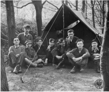
Grupa harcerzy ZHP przed namiotem, 1947.