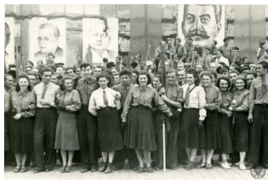
Członkowie Związku Młodzieży Polskiej (ZMP) prawdopodobnie przed pochodem 1 Maja w Gdańsku, 1945 - 1952.