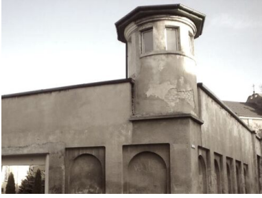
Areszt UB w. Radomiu

Podejrzanych początkowo osadzono w areszcie w Radomiu, a następnie w czerwcu 1953 r. przewieziono ich do więzienia przy ul. Montelupich w Krakowie. Zarzucono im