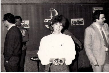
Spotkanie Komitetu Obywatelskiego „Solidarność” w Starachowicach.

parlamencie. Wokół takich założeń politycznych skupiła się duża grupa ludzi i to właśnie umożliwiło powstanie zorganizowanej struktury KPN-u w Kielcach.