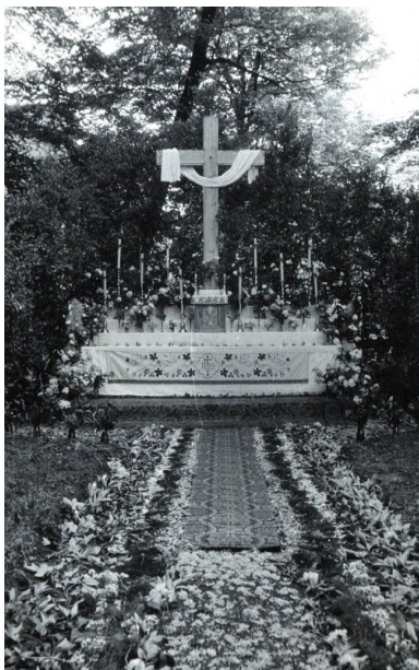
Krzyż na placu przy kościele Najświętszego Serca Pana Jezusa w czerwcu 1960 r.