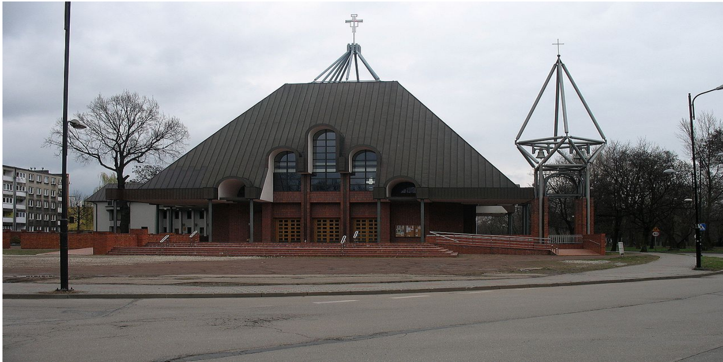
Kościół parafii Najświętszego Serca Pana Jezusa w Gliwicach.

https://przystanekhistoria.pl/pa2/teksty/82081,Krzyz-na-ciezarowce-Wokol-protestu-gliwickiego-w-1960-roku.html