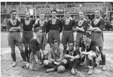
Drużyna piłkarska klubu sportowego Pogoń Lwów, 1922-1926. Stoją od lewej: