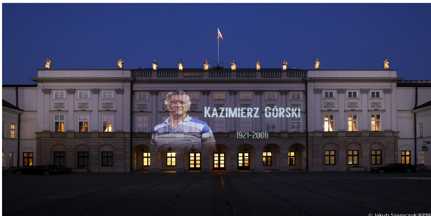
Illuminacja na fasadzie Pałacu Prezydenckiego upamiętniająca Kazimierza Górskiego.

https://przystanekhistoria.pl/pa2/teksty/81755,Lwowiak-na-Wembley.html