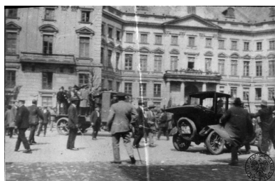
Starcia bojówki P.P.S. z robotnikami demonstrującymi pod sztandarami K.P.P. na Placu Teatralnym w Warszawie, 1 maja 1928 r.

Praca komisji programowej nad programem Kominternu trwała od 1922 r. W czerwcu 1923 r. na III Plenum Komitetu Wykonawczego Kominternu utworzono drugą komisję do spraw programu, której polecono zaangażować wszystkie sekcje Kominternu w celu omówienia i opracowania odpowiedniego projektu programu na następny kongres. Projekty programu były prezentowane na V Kongresie (czerwiec-lipiec 1924 r.), ale wówczas nie został on przyjęty. Powołano natomiast nową komisję, która miała kontynuować pracę nad przygotowaniem programu. Dopiero cztery lata później, 25 maja 1928 r., komisja opracowała dokument znany, jako „Projekt Programu”.