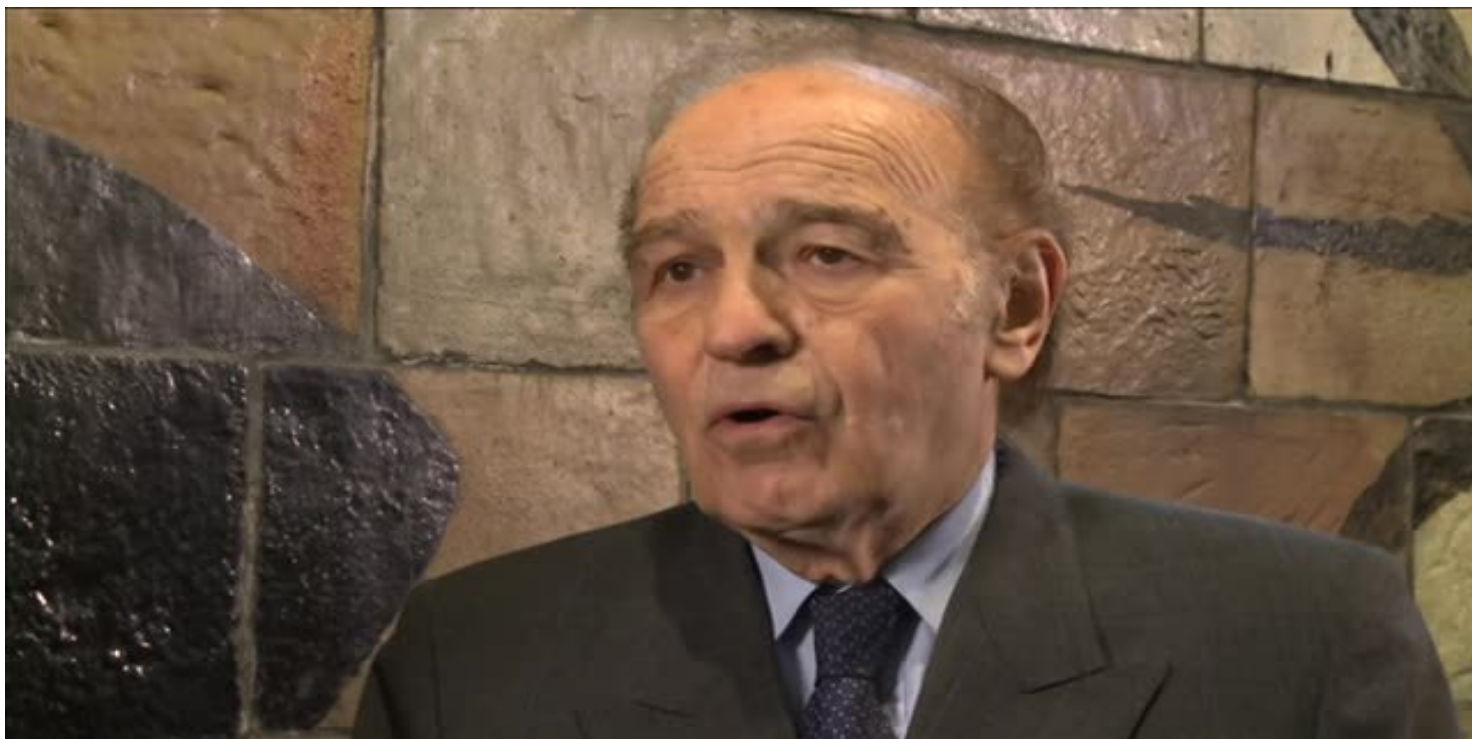
Samuel Pisar - światowa kariera chłopca z Białegostoku

https://przystanekhistoria.pl/pa2/teksty/81373,Samuel-Pisar-swiatowa-kariera-chlopca-z-Bialelegostoku.html