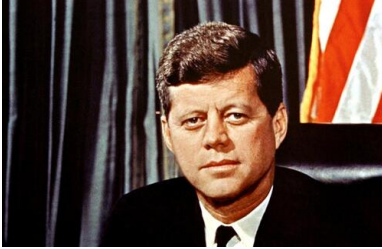
John F. Kennedy - 35. prezydent USA