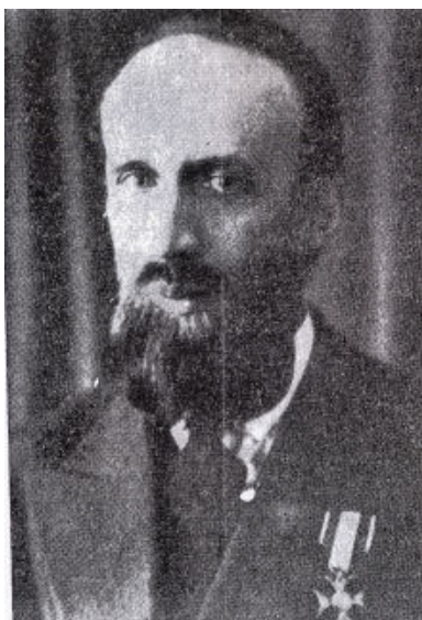
Tadeusz Szturm de Sztrem w 1933 r.