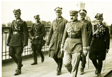
Józef Piłsudski w otoczeniu najbliższych współpracowników na moście Poniatowskiego, 12 maja 1926 r.

Zdecydowanie, w skali kraju, ożywiło się również budownictwo mieszkaniowe. Na wsi zaś znacznie wzrosło tempo parcelacji. Rosły, innymi słowy, pokłady społecznej nadziei.