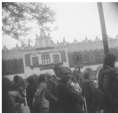
Czarny marsz w Krakowie, 15 maja 1977 r.