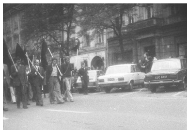
Czarny marsz w Krakowie, 15 maja 1977 r.