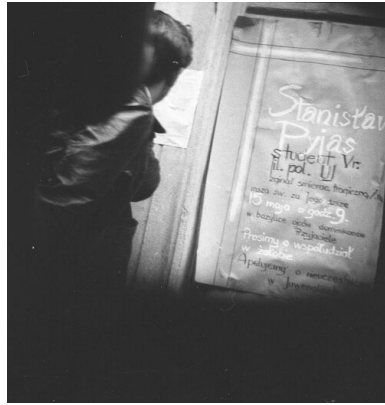
Zdjęcie z esbeckiej obserwacji na Szewskiej 7 w Krakowie.