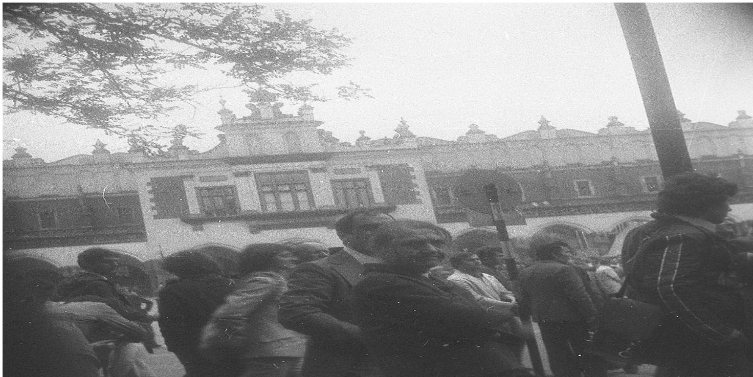
Czarny marsz w Krakowie, 15 maja 1977 r.

https://przystanekhistoria.pl/pa2/teksty/81241,Studencka-solidarnosc-odpowiedzia-na-zamordowanie-Stanislawa-Pyjasa.html