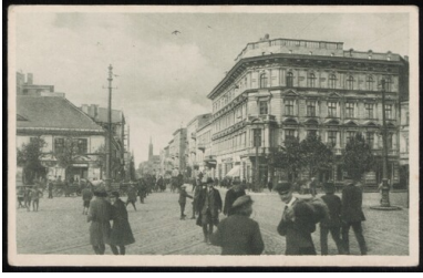
Łódź, Plac Wolności. Poczтівka wydana w Warszawie w okresie wolnej Polski - Drugiej Rzeczpospolitej. Ze zbiorów cyfrowych Biblioteki Narodowej (polona.pl)