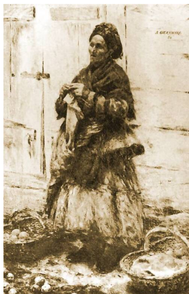
Obraz Żydówka z pomarańczami Aleksandra Gierymskiego przed II wojną światową znajdował się w