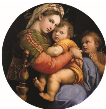
Madonna della Sedia - reprodukcja dzieła Rafaela autorstwa Ireny Serdy-

„Niemcy uprawiają dziki i prymitywny rabunek, co robi wrażenie «ewakuacji w pośpiechu». Rzuca się w oczy rażąca nieuczciwość Niemców. Powszechny jest widok wojskowych i urzędników dźwigających wielkie paczki towarów zabranych w sklepach polskich”.