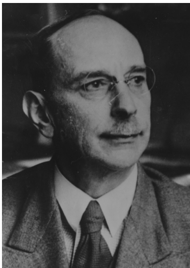
Hans Posse, dyrektor Drezdeńskiej Galerii Obrazów. Fotografia portretowa z 1942 r.

Posse w pierwszej kolejności spenetrował zbiory warszawskie – w grudniu 1939 r., a kolejną wizytację planował po lutym 1940 r. Miał prawo pierwszeństwa, co pozwoliło mu na wybranie najcenniejszych dzieł sztuki do muzeum w Linzu. Przy okazji zabiegał również o wywiezienie do Dreżna ocalałych części urządzeń Zamku Królewskiego w Warszawie. Następnie przejrzał zbiory prywatne, publiczne i kościelne w Krakowie i Warszawie. Warto przytoczyć fragment jego sprawozdania na temat przeprowadzonych prac: