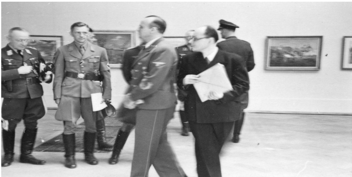
Hans Frank (3 z lewej) w towarzystwie oficerów i cywilów zwiedza nierozpoznaną galerię.

https://przystanekhistoria.pl/pa2/teksty/80984,Portret-niemieckich-grabiezcow.html