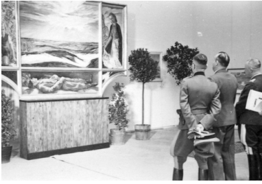
Hans Frank (w środku) w towarzystwie nierozpoznanych osób podczas zwiedzania galerii w Krakowie.