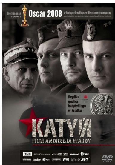
Plakat filmu "Katyń" w reżyserii Andrzeja Wajdy