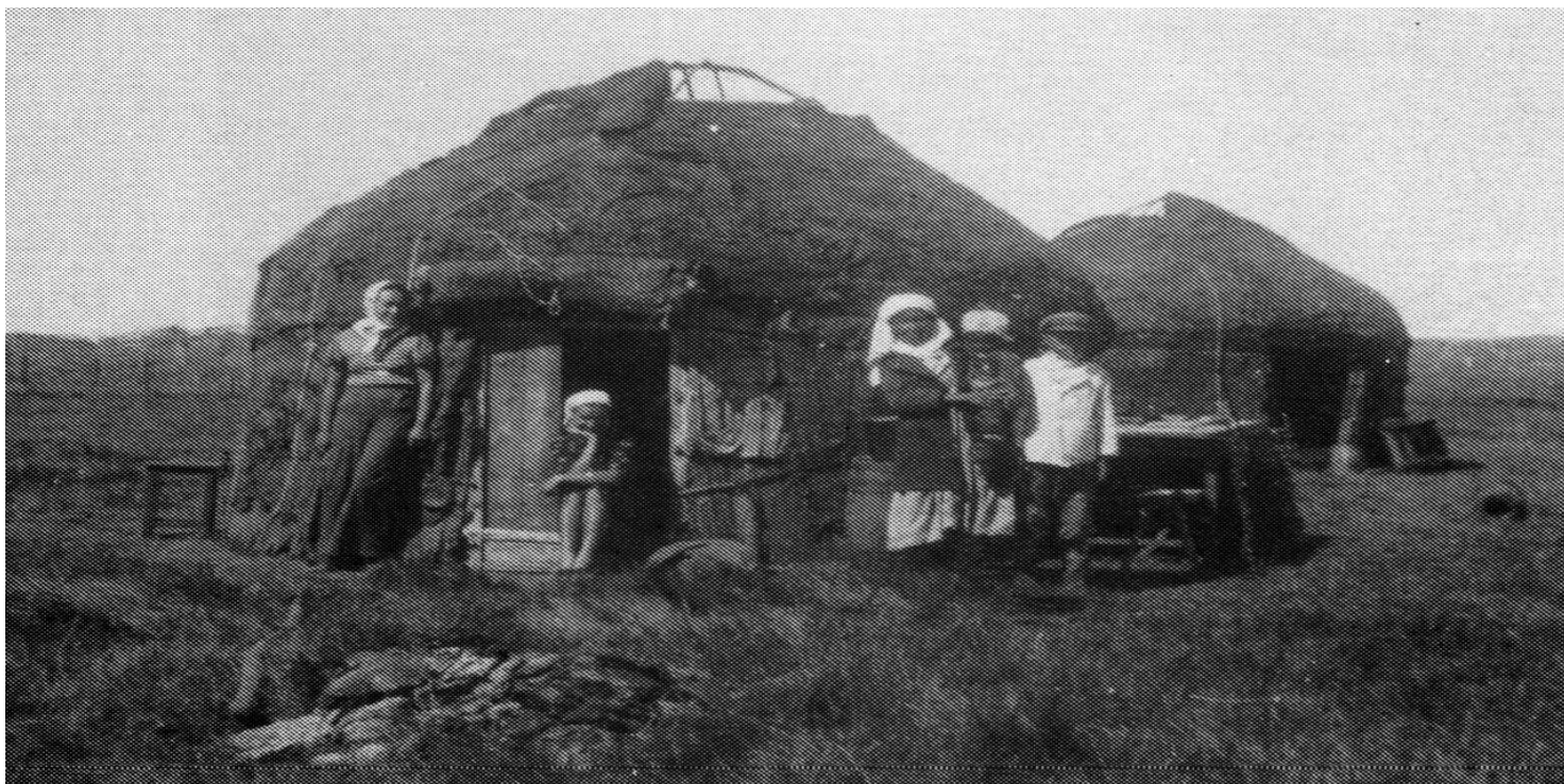
Więźni na pustkowi.

https://przystanekhistoria.pl/pa2/teksty/80206,Polsko-kazachskie-spotkanie-w-latach-II-wojny-swiatowej.html