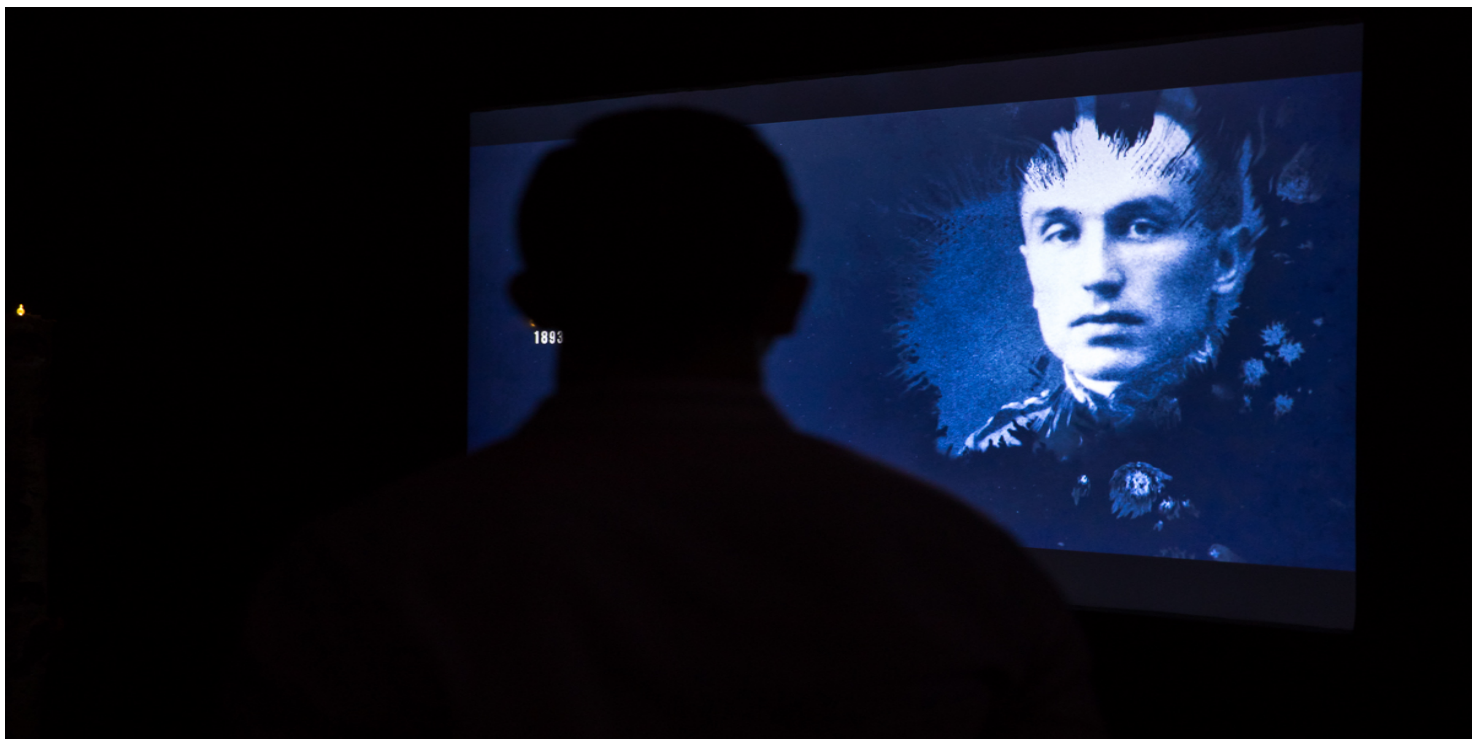
Wystawa IPN „20 – 40 – 20” .

https://przystanekhistoria.pl/pa2/teksty/80197,Zbrodnia-katynska-w-archiwaliach-IPN.html