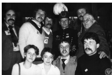
Delegaci na I Walne Zebranie Delegatów NSZZ 'Solidarność' Regionu Elbląskiego, 1981 r.