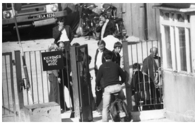
Brama Elbląskiego Przedsiębiorstwa Budownictwa Przemysłowego, 28 sierpnia 1980 r.