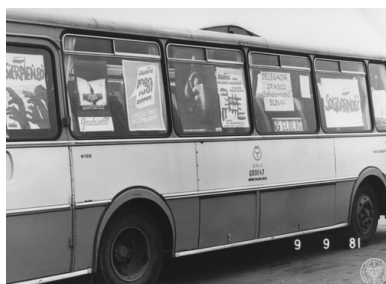
Autokar delegacji NSZZ 'Solidarność' Regionu Elbląskiego na parking przed halą Olivia w Gdańsku, 9 września 1981 r., ze