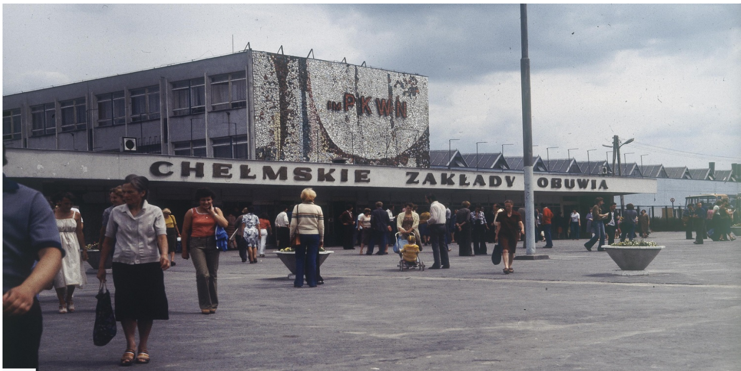
Chelmskie Zakłady Obuwia im. PKWN przy ulicy Wojsławickiej, 1979 r.

https://przystanekhistoria.pl/pa2/teksty/80104,Poczatki-Solidarnosci-w-Chelmie.html