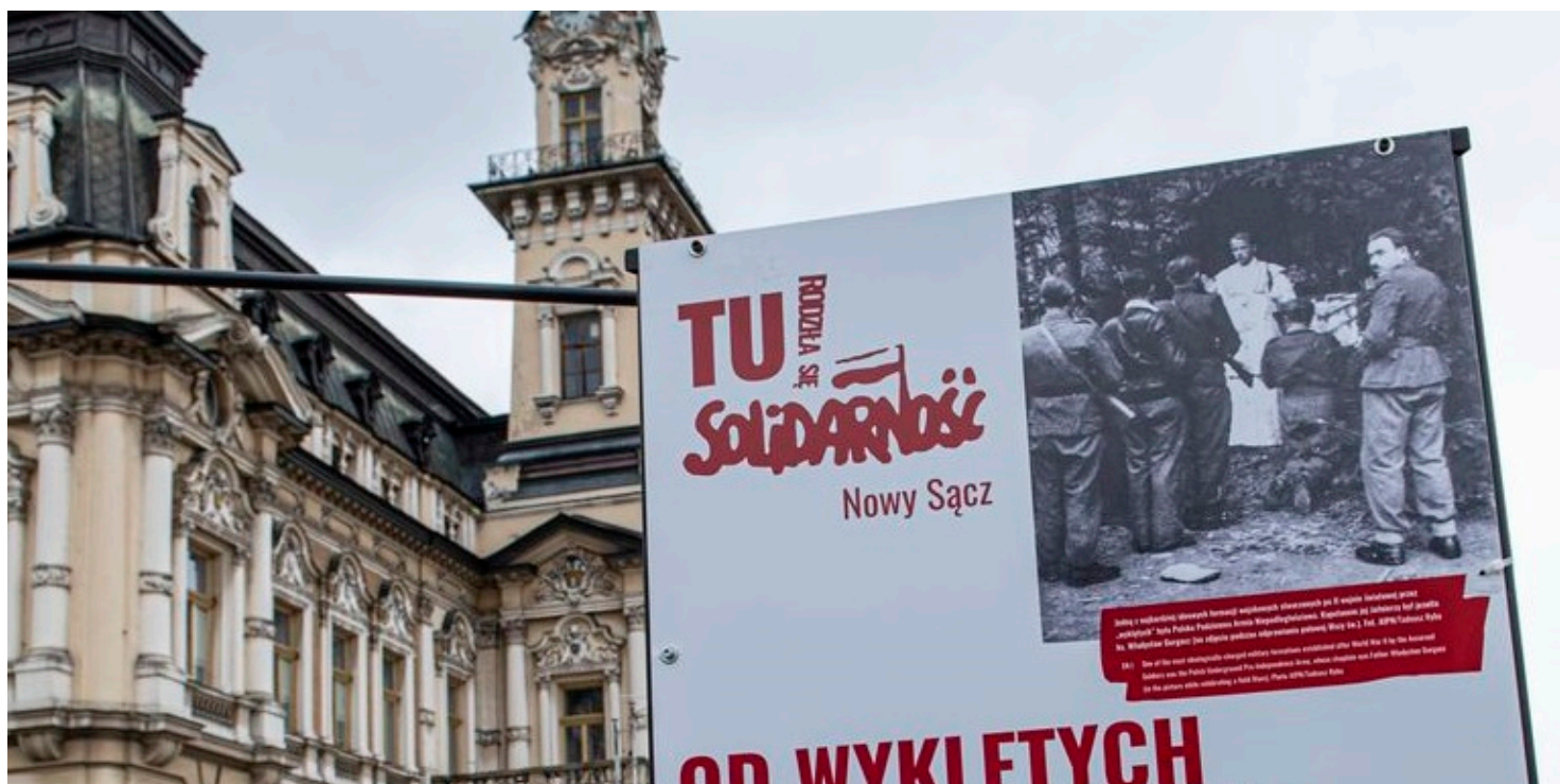
Wystawa „TU rodziła się Solidarność” w Nowym Sączu

https://przystanekhistoria.pl/pa2/teksty/80092,Poczatki-niezaleznego-ruchu-zwiazkowego-w-Gorlicach.html