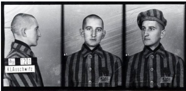
Franciszek Blachnicki w KL Auschwitz, 1940. Ze zbiorów Państwowego Muzeum Auschwitz-Birkenau. Fot. Wikimedia Commons/domena publiczna

Boski dar wolności może być w pełni wykorzystany przez człowieka tylko w połączeniu z miłością. Takie pojmowanie źródeł ludzkiej wolności prowadziło ks. F. Blachnickiego do bezbłędnego diagnozowania przyczyn i form zniewolenia – zarówno osoby ludzkiej, jak i całych społeczeństw. Zniewolenie zawsze ma swoje podstawy w fałszywej wizji ludzkiej wolności. Polega na niewłaściwym użytku z wolności, jest bowiem wypaczeniem miłości przez zwrócenie jej ku sobie 6 .