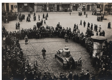
Francuscy strzelcy alpejscy na katowickim rynku, lata 1920-1921