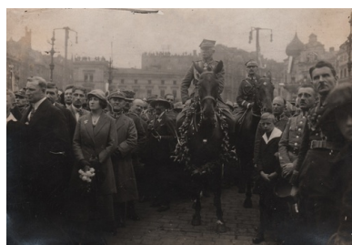
Powstańcy śląscy w okresie III powstania, 1921 r.