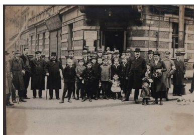
Grupa głoszących przed jednym z lokali wyborczych w Katowicach