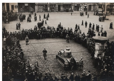
Francuscy strzelcy alpejscy na katowickim rynku, lata 1920-1921