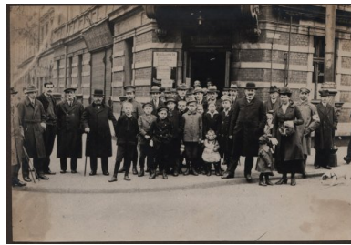
Grupa głosujących przed jednym z lokali wyborczych w Katowicach