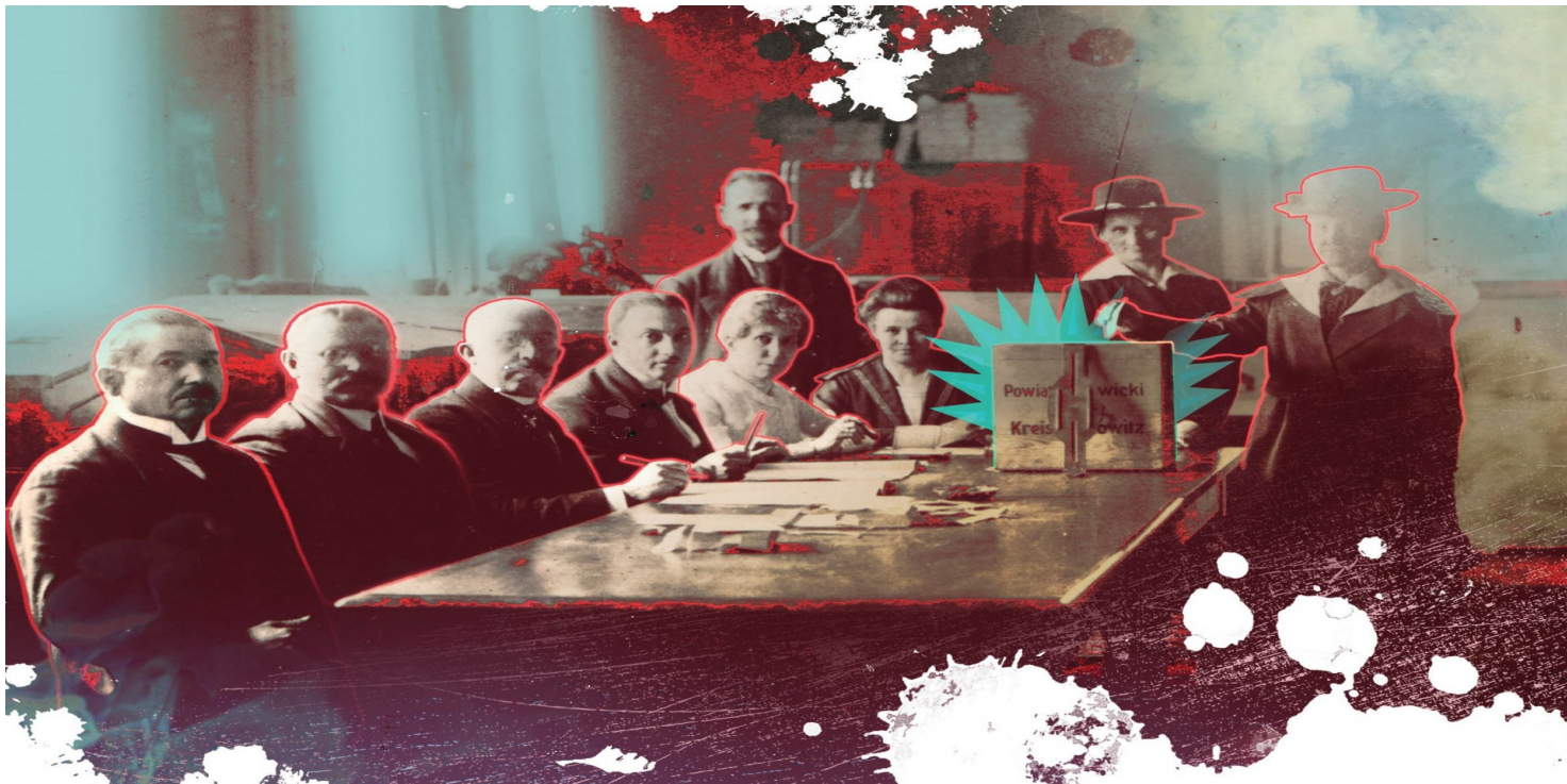
Jeden z katowickich, plebiscytowych lokali wyborczych. Fot. ze zbiorów AP Katowice na grafice kalendarza IPN Katowice na 2021 r.

https://przystanekhistoria.pl/pa2/teksty/79946,Powstania-slaskie-i-plebiscyt-w-objektywie-Rysowanie-za-pomoca-swiatla-a-sprawa-.html