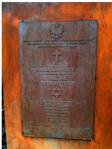
Tablica pamiątkowa na pomniku w Popardowej.