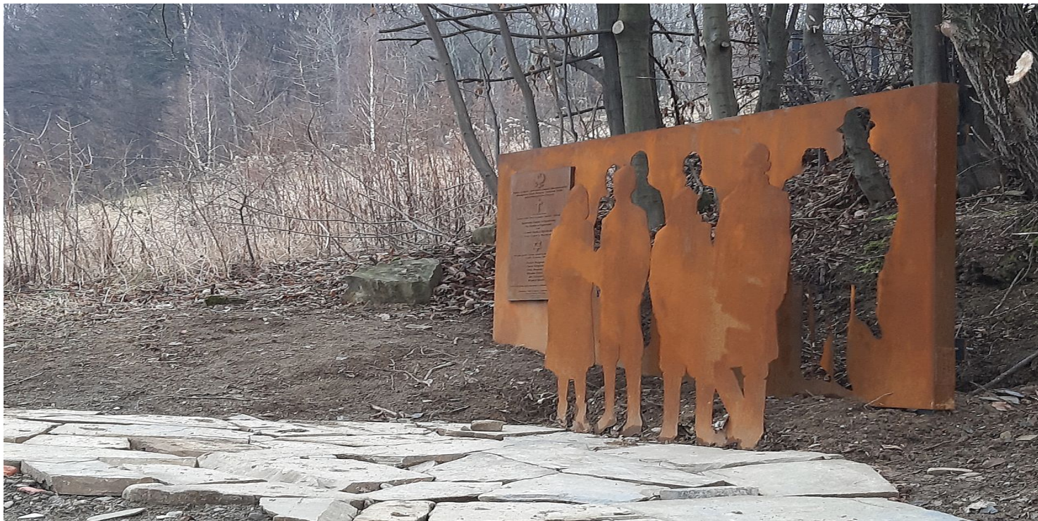
Pomnik w Popardowej.

https://przystanekhistoria.pl/pa2/teksty/79921,Ruminowie-Borek-i-Tokarz-zamordowani-za-pomoc-Zydom-na-Sadeczczyźnie.html