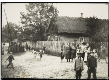
Żydowska kolonia Jakowlewa na Polesiu, przed 1939.

Zaznajamianie się z treściami ksiąg pamięci jest dla polskiego czytelnika może nawet bardziej istotne, aniżeli dla mówcy jakiegokolwiek innego języka (poza samą społecznością żydowską rzecz jasna). Po pierwsze dlatego, że większość z nich dotyczy właśnie Polski. Z około 700 klasycznych ksiąg pamięci 540 dotyczy miejscowości leżących w roku 1939 w granicach Państwa Polskiego. Po drugie, wraz z rozwojem zainteresowania holocaustem i historią Żydów, księgi te są w coraz większym stopniu wykorzystywane przez historiografię światową, a co za tym idzie, wcześniej czy później, i tak dotrą do polskiej opinii społecznej. Po trzecie wreszcie, po dziś dzień, powstałe kilkadziesiąt lat temu publikacje, są ważnymi, a czasami nawet najważniejszymi, opracowaniami do dziejów I połowy XX wieku, w szczególności okresu międzywojennego. I dotyczy to nie tylko historii lokalnej społeczności żydowskiej, ale niekiedy w ogóle dziejów danej miejscowości.