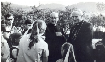
Kadr z filmu dokumentalnego „Prorok nie umiera - ks.

„Miał w sobie charyzmat wodza, ale nie dyktatora, lecz raczej przewodnika”.