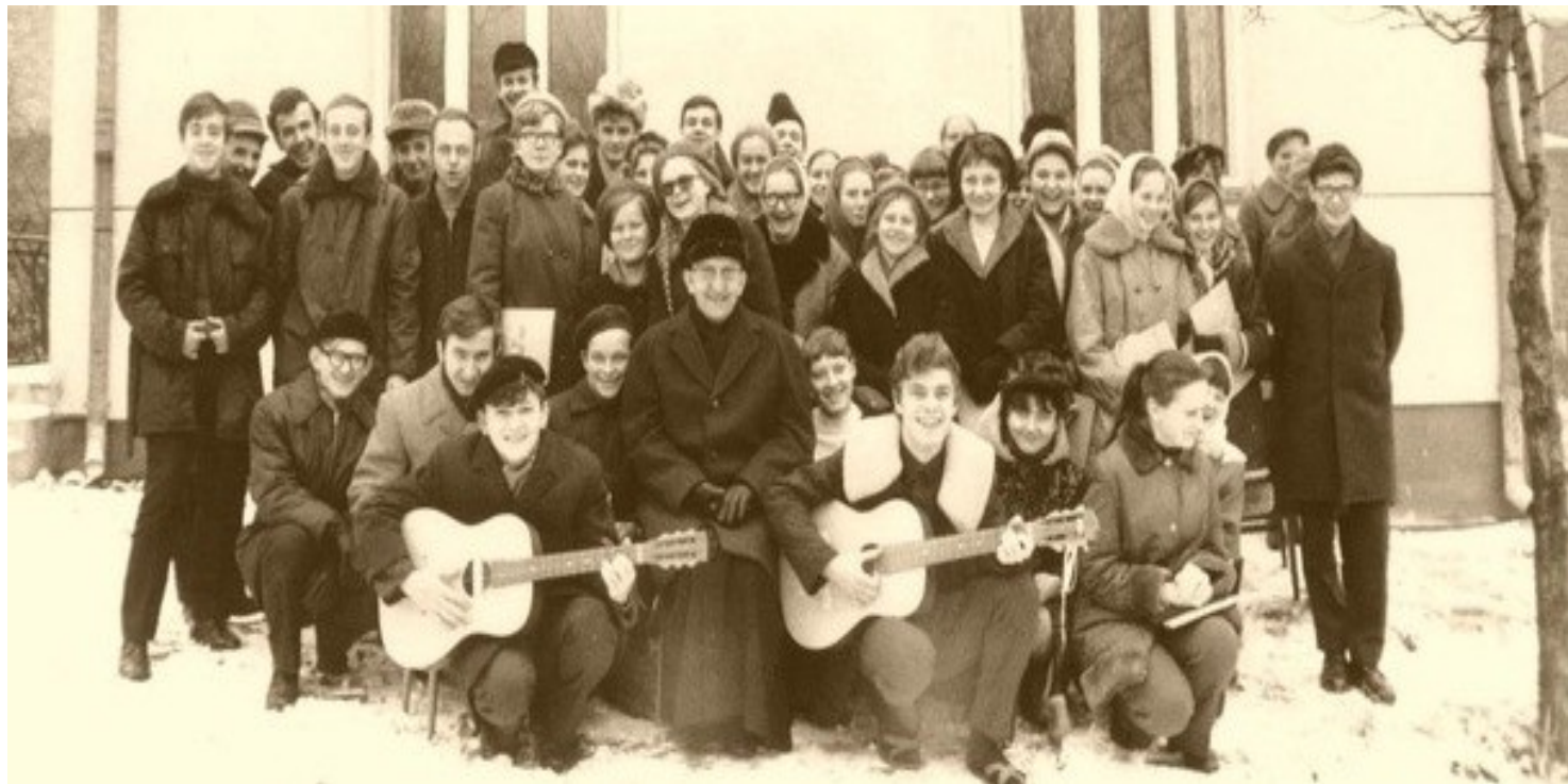
Rekolekcje dla animatorów w Lublinie w 1972 r.

https://przystanekhistoria.pl/pa2/teksty/79601,Przewodnik-w-czasach-zniewolenia-ks-Franciszek-Blachnicki.html