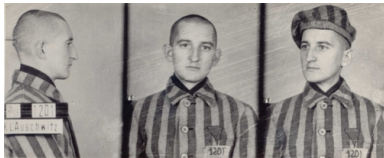
Zdjęcie Franciszka Blachnickiego z KL Auschwitz

W pracy duszpasterskiej wprowadzał nowatorskie pomysły, mające na celu odnowę moralną społeczeństwa i żywą wiarę. Zainicjował ruch trzeźwościowy pod nazwą Krucjata Wstrzemięźliwości, angażował się na rzecz posoborowej odnowy liturgii w Polsce. Wykładał na Katolickim Uniwersytecie Lubelskim. Niewątpliwie dziełem jego życia był „Ruch Światło-Życie”, tzw. ruch oazowy, alternatywa dla laickiego wychowania młodzieży.