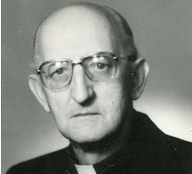
Ksiądz Franciszek Blachnicki

wikariusza kapitulnego narzuconego przez władze. Aparat bezpieczeństwa prowadził przeciw niemu działania operacyjne pod kryptonimem „Zawada”. W 1961 r. przebywał cztery i pół miesiąca w więzieniu w związku z kolportowaniem „Memoriału” na temat brutalnej likwidacji przez władze Centrali Krucjaty Wstrzemięźliwości. Był też szykanowany i represjonowany z powodu tzw. ruchu oazowego.