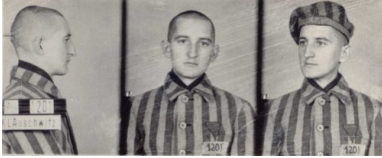
Zdjęcie Franciszka Blachnickiego z KL Auschwitz

W pracy duszpasterskiej wprowadzał nowatorskie pomysły, mające na celu odnowę moralną społeczeństwa i żywą wiarę. Zainicjował ruch trzeźwościowy pod nazwą Krucjata Wstrzemięźliwości, angażował się na rzecz posoborowej odnowy liturgii w Polsce. Wykładał na Katolickim Uniwersytecie Lubelskim. Niewątpliwie dziełem jego życia był „Ruch Światło-Życie”, tzw. ruch oazowy, alternatywa dla laickiego wychowania młodzieży.