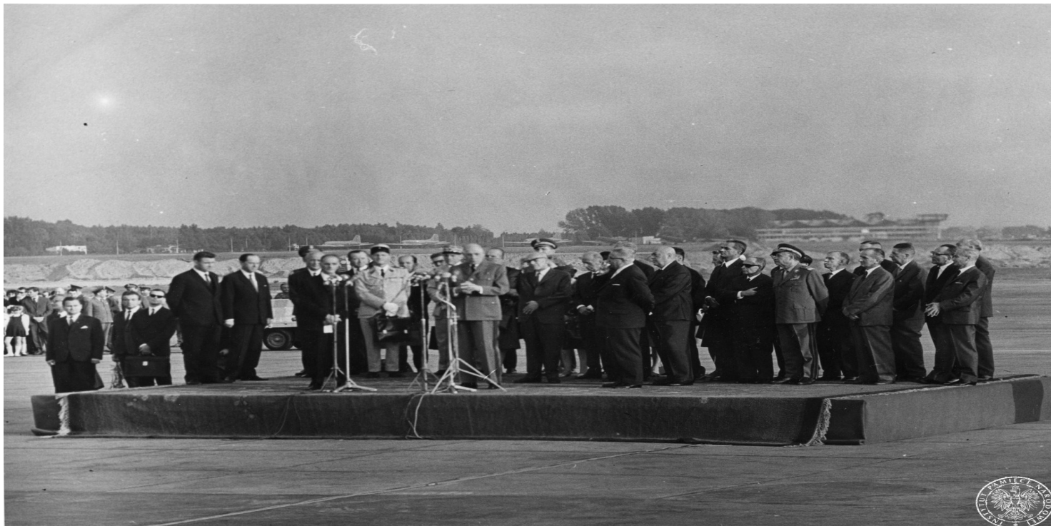
Powitanie prezydenta Francji gen. Charlesa de Gaulle'a na lotnisku Okęcie w Warszawie. Przemówienie powitalne prezydenta Francji.

https://przystanekhistoria.pl/pa2/teksty/79396,Operacja-Uran-Sluzba-Bezpieczenstwa-wobec-wizyty-Charlesa-de-Gaullea-w-wojewodzt.html