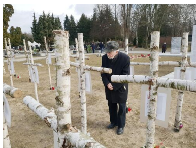
„Łączka”, 1 marca 2019. Fot.