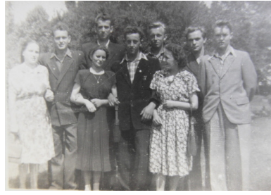
Cزيونkowie organizacji w 1952 r. nieopodal tomaszowskich Niebieskich Źródeł

Miano przeciwstawiać się rusyfikacji i bolszewizacji młodego pokolenia, osiąganym przez fałszywe nauczanie historii Polski, walkę z religią i Kościołem katolickim, demoralizację i rozpijanie młodzieży. Podkreślano, że w chwili walki nie może zabraknąć harcerzy, mających chlubne karty w działalności niepodległościowej.