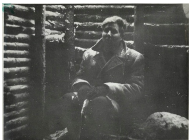
Jeden z członków HKP-KWP w bunkrze podczas wizji lokalnej