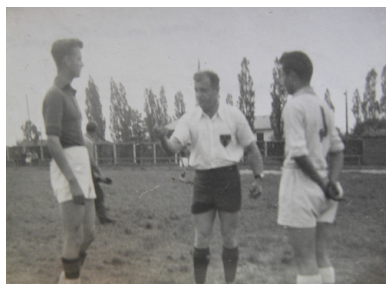
Przed meczem piłkarskim „Ogniwa” w 1952 r.