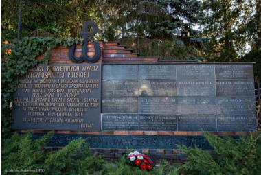
Pruszków, pomnik pamięci 16 przywódców Polskiego Państwa Podziemnego - ofiar sowieckiej zbrodni w 1945 r.

następujące wyroki: gen. Okulicki – 10 lat więzienia, Jankowski – 8 lat, Bień – 5 lat, Jasiukowicz – 5 lat, Pużak – 1,5 roku, Bagiński – 1 rok, Zwierzyński – 8 miesięcy, Czarnowski – 6 miesięcy, Mierzwa, Stypułkowski, Chaciński, Urbański – 4 miesiące. Uniewinnieni zostali: Michałowski, Kobylański i Stemler-Dąbski, zaś Pajdak w osobnym procesie został skazany na 5 lat więzienia 6 .