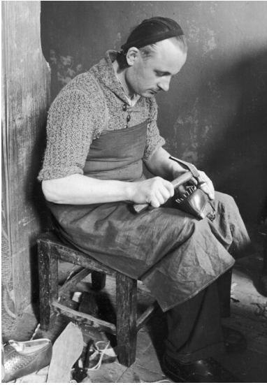
Szewc przy pracy. Okres Drugiej Rzeczypospolitej.