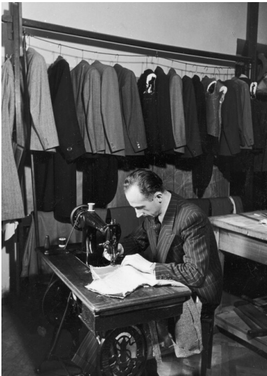
Krawiec przy maszynie. Okres Drugiej Rzeczypospolitej. Autor: Henryk Poddębski. Ze zbiorów Narodowego Archiwum Cyfrowego