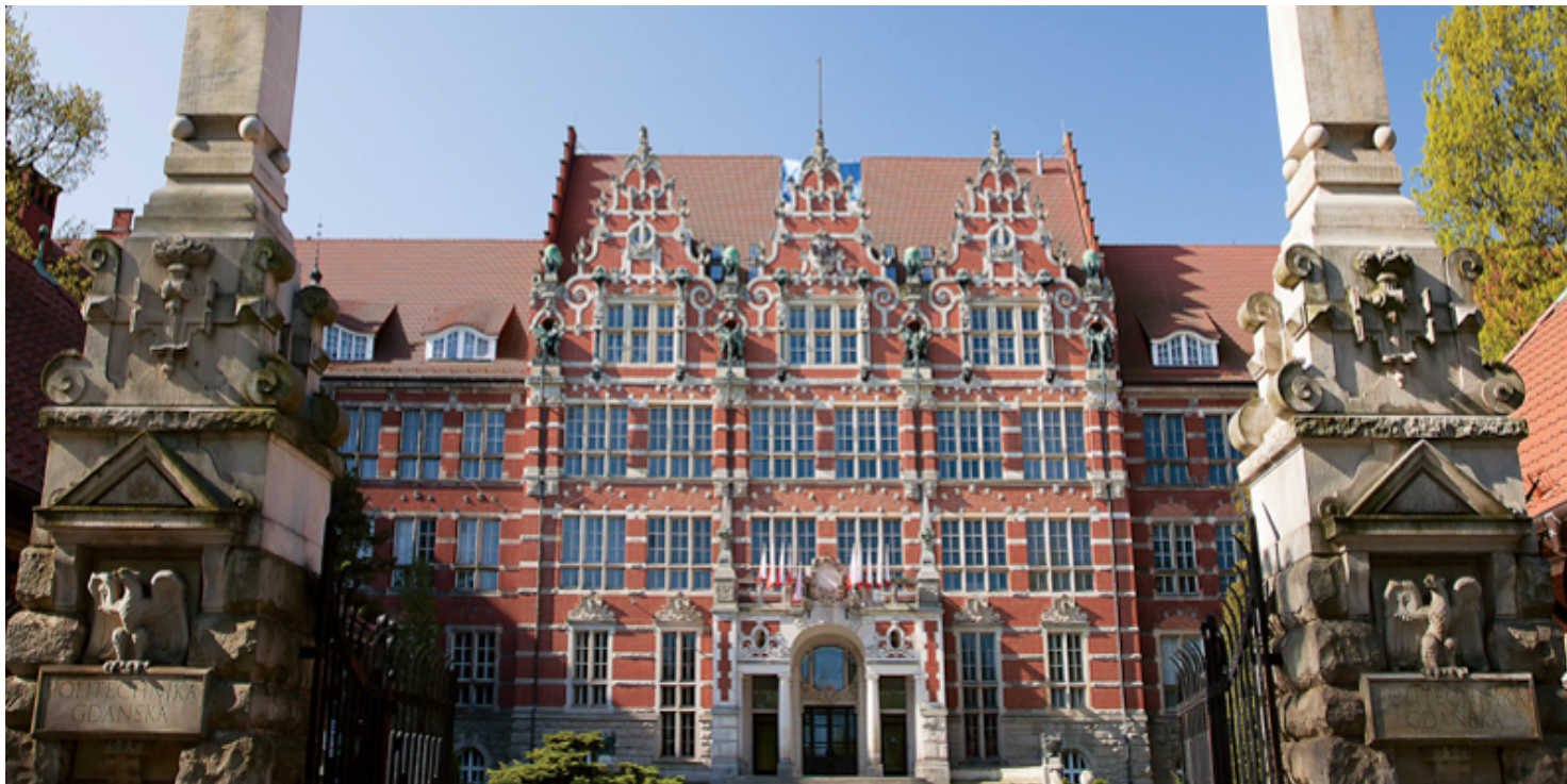
Gmach główny Politechniki Gdańskiej

https://przystanekhistoria.pl/pa2/teksty/78490,Szkola-demokratycznego-myslenia-za-Zelazna-Kurtyna-Uczelni-any-Parlament-ZSP-Poli.html