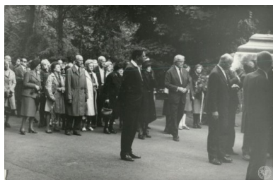
Jan Olszewski na pogrzebie Kazimierza Moczarskiego, październik 1975 r.