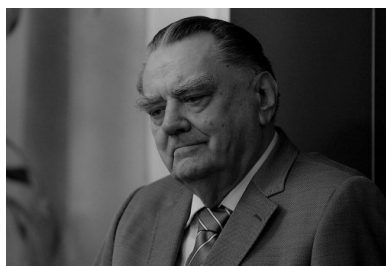
Jan Olszewski.

Po ogłoszeniu stanu wojennego pełnił funkcję doradcy w Sekretariacie Episkopatu Polski. Występował jako oskarżyciel posiłkowy w procesie morderców ks. Jerzego Popiełuszki. W 1988 r. współtworzył Komitet Obywatelski przy Przewodniczącym NSZZ „Solidarność” Lechu Wałęsie. Opowiadał się przeciwko dążeniu do porozumienia z komunistami. Odmówił objęcia z ramienia tzw. strony społecznej stanowiska przewodniczącego „podstolika” do spraw reformy prawa i sądów przy „okrągłym stole”.