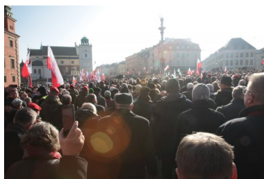
Warszawa, Polacy żegnają Jana Olszewskiego. 16 lutego 2019.