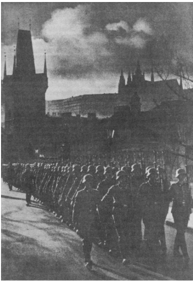
Niemiecka okupacja Czech i Moraw, wojska hitlerowskie w Pradze, 1939.

Praktycznie w całej książce nie znajdujemy odniesienia do relacji polsko-czechosłowackich w zakresie operacji specjalnych. Co wobec planowanej konfederacji polsko-czechosłowackiej oraz wspólnych planów w zakresie działalności konspiracyjnej na terenach obu okupowanych krajów – jest niezrozumiałe.