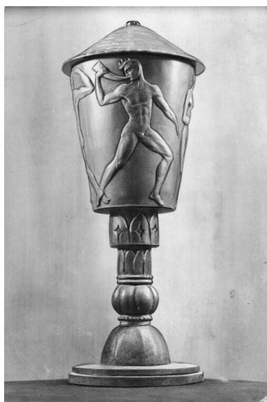
Puchar dla najlepszej drużyny mistrzostw ufundowany przez

Ponadto mieli oni wprowadzać do sportowej rywalizacji „element nacjonalistyczny”. Potwierdzenie tej tezy stanowił sposób gry w meczu z Węgrami, określony mianem „zwyczajnego, karczemnego łobuzerstwa”.