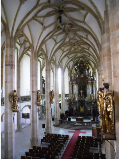
Obecny Most (Czechy), wewnątrz kościoła Wniebowzięcia Najświętszej Marii Panny.

Wyburzenie Mostu nie było przypadkiem jednostkowym, zgodnie z szacunkami z lat dziewięćdziesiątych, w okresie lat 1975-1985 władze doprowadziły do wyburzenia 10% obiektów zabytkowych, aby zrobić miejsce dla bloków i mieszkań z tanich komponentów. W konsekwencji wyburzono ok. 3 000 nieruchomości zabytkowych.