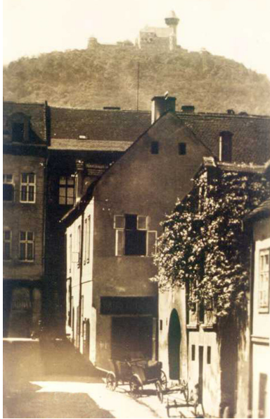
Ulica w dawnym Moście u podnóża wzgórza zamkowego, około 1890.

Jednakże dziś na próżno szukać miasta w ofertach biur podróży, katalogach czy folderach wycieczkowych. O Moście nie ma też informacji w licznie wydawanych i bogato ilustrowanych przewodnikach po Czechach. Dlaczego? Aby móc odpowiedzieć na to pytanie należy cofnąć się do epoki triumfu funkcjonalności, centralnego planowania, monumentalności świadczącej o potędze, „przyjaźni narodów”; słowem do czasów ZSRS.