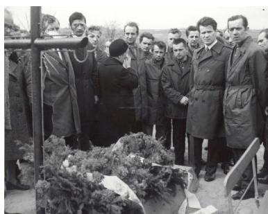
Delegacja gdańskich stoczniovców składa wieńce na grobie zabitych w Grudniu '70 na cmentarzu św. Franciszka w Gdańsku-Emaus, 8 maja 1971 r.